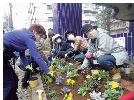
「植付け・水やり」の様子