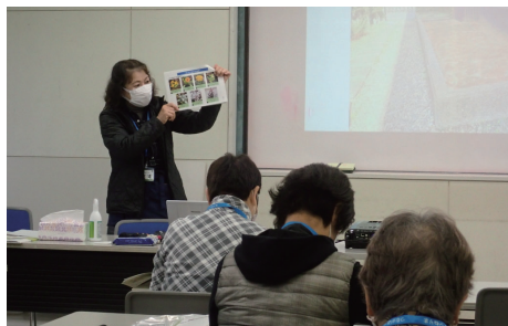
「季節のテーマとデザイン」の様子