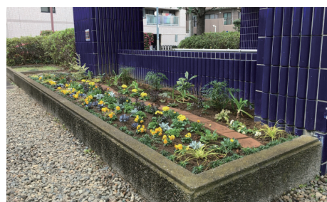
植栽した「あいあいガーデン」